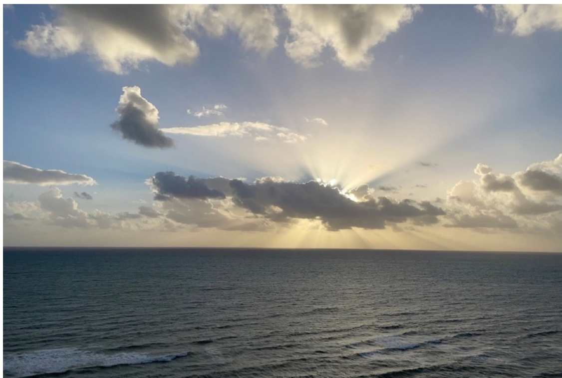
Sol entre las nubes.jpg