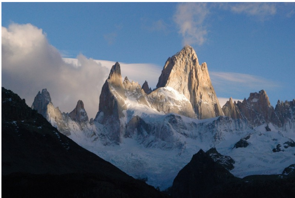
Amanecer en el Fitz Roy.jpg

Para el caso de las fotografías de formato vertical, seguir exactamente el mismo procedimiento, manteniendo siempre el valor de 1080 píxeles para el lado vertical.